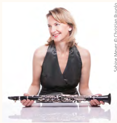
Sabine Meyer