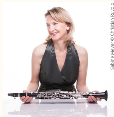
Sabine Meyer